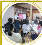
9.25 たけプロジェクト

松山市窪野町の正 八幡神社で「いよ 窪野収穫祭」を開 催。彼岸花の名所 を訪れる観光客に、 地元野菜や果物・ 献上米「窪野米」 などを販売しまし た。多くの方が地 元の特産品を買い 求めていました。