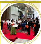
11.23 NPO愛媛室内 合唱団

堀江町のOICCOLLA 亭で「ポテッタ収穫 in堀江」を開催。未 就学の子どもに対 して、絵本の読み聞 かせやイースのツルを使 ったクリスマスリース 作りをしました。近く の畑では、サツマイ モやショウガの収穫 も楽しみました。