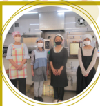
10.5 特定非営利活動法人 ハッピーハート

小学生を対象に「 たけプロジェクト 放置竹林ってなあ に？」を開催。地 域課題である放置 竹林をテーマに SDGsの取り組み を学びました。子 どもたちは、竹を 活用して自分か作 りたいものを発表 しました。