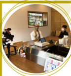
9.21 志国イムス プロジェクト

四国の道路道周辺の施設の観光振興を 目指し、PR動画を撮 影。今回は、お遍路 さんか利用する石手 寺近の「めい」にて、 店主とインタビ ュアーが対談する様 子を撮影しました。 PR動画の完成が楽し みです。