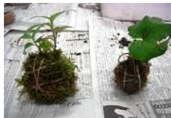
出来上がったコケ玉